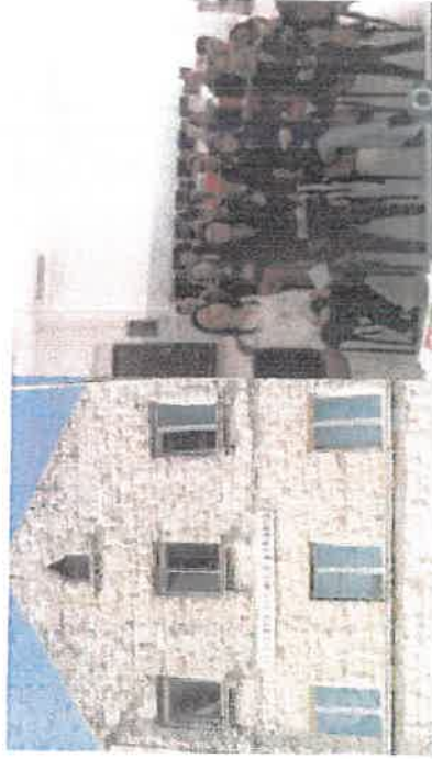
Schimb de experiență regiunea Bari - Italia