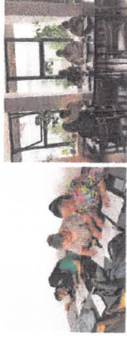
Modul de prezentare CAF